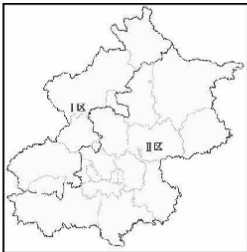
图 1 北京市暴雨分区图

北京市分为2个暴雨分区。以镇级行政区作为划分基础单元。房山区的史家营乡、大安山乡、佛子庄乡，门头沟区的清水镇、斋堂镇、雁翅镇、妙峰山镇、大台街道、王平镇、潭柘寺镇，昌平区的流村镇、阳坊镇、马池口镇、南口镇，海淀区的上庄镇，延庆县的八达岭镇、康庄镇、大榆树镇、井庄镇、延庆镇、沈家营镇、张山营镇、旧县镇、永宁镇、香营乡、刘斌堡乡、四海镇、大庄科乡、千家店镇、珍珠泉乡，怀柔区的宝山镇、九渡河镇、汤河口镇、长哨营满族乡、喇叭沟门满族乡等乡镇划为第 I 区；其余地区划为第 II 区。本附录中北京市暴雨强度公式及分区参照《城镇雨水系统规划设计暴雨径流计算标准》DB11/T 969。